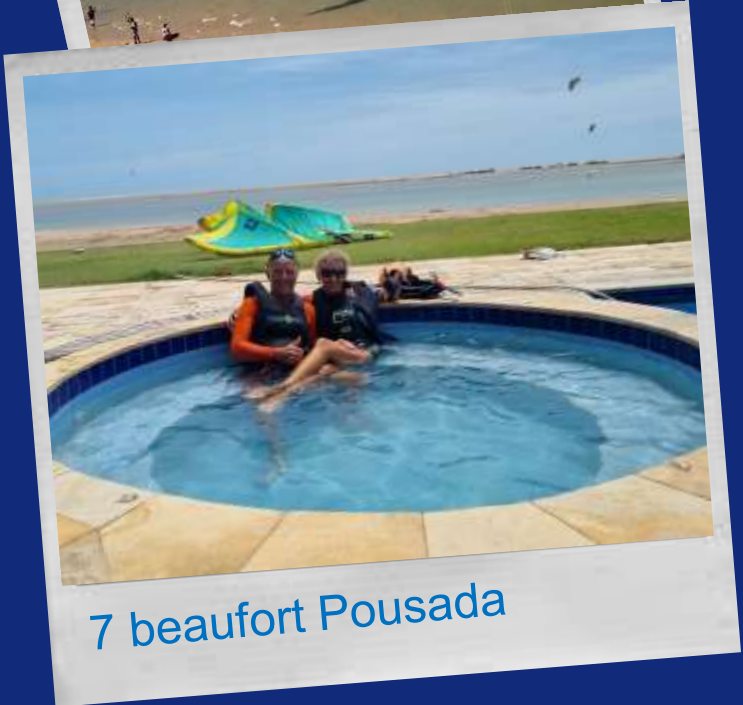
7 beaufort Pousada