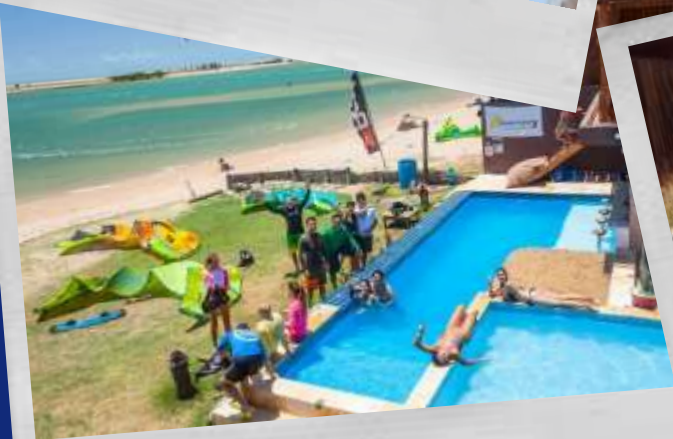
Ilha de Guajuru