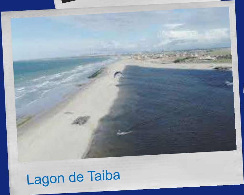
Lagon de Taiba