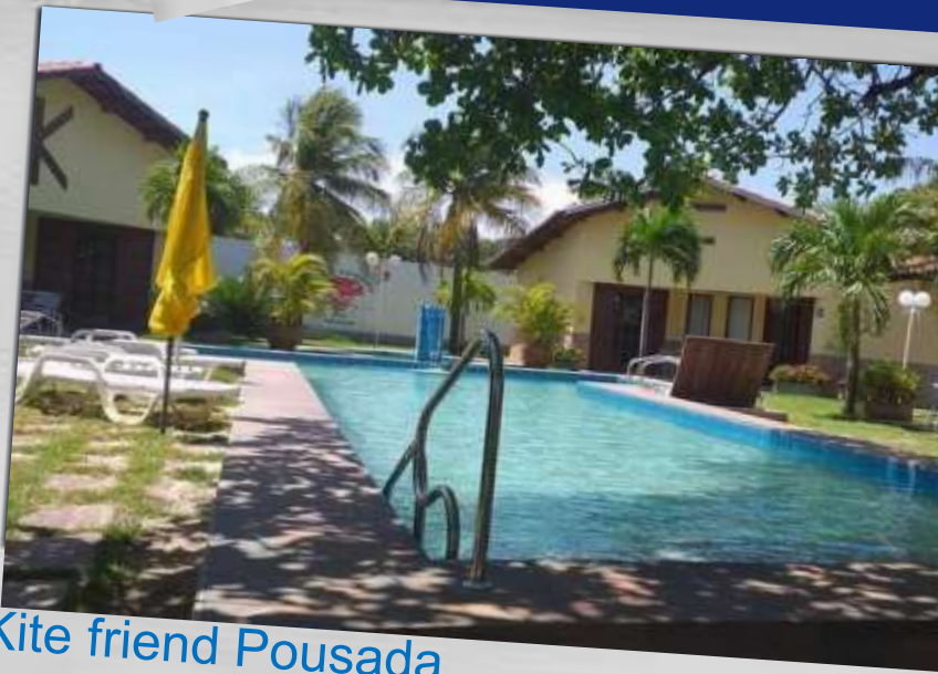
Kite friend Pousada