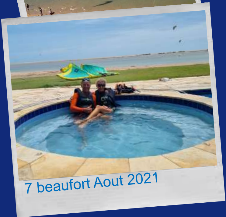
7 beaufort Aout 2021