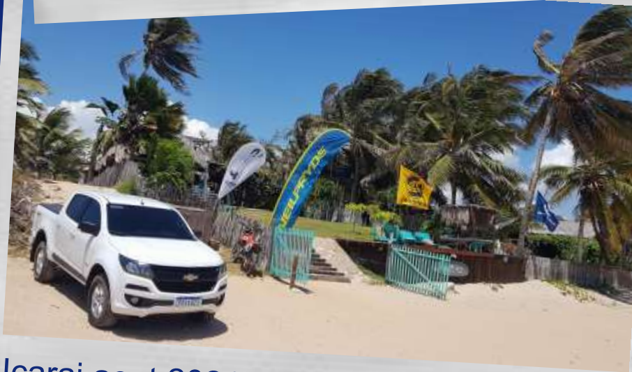
Icarai aout 2021